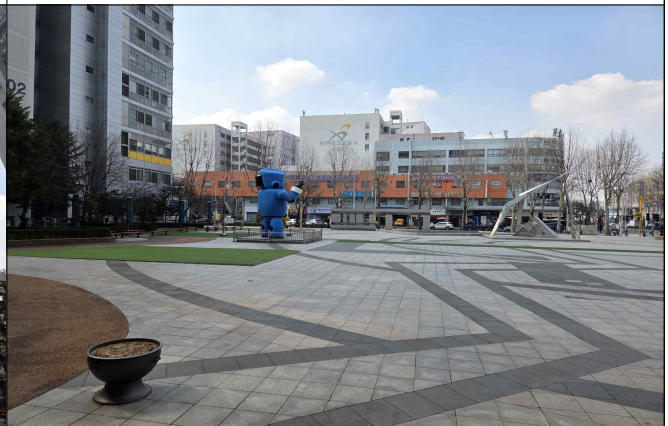
부천테크노파크 401동 전경